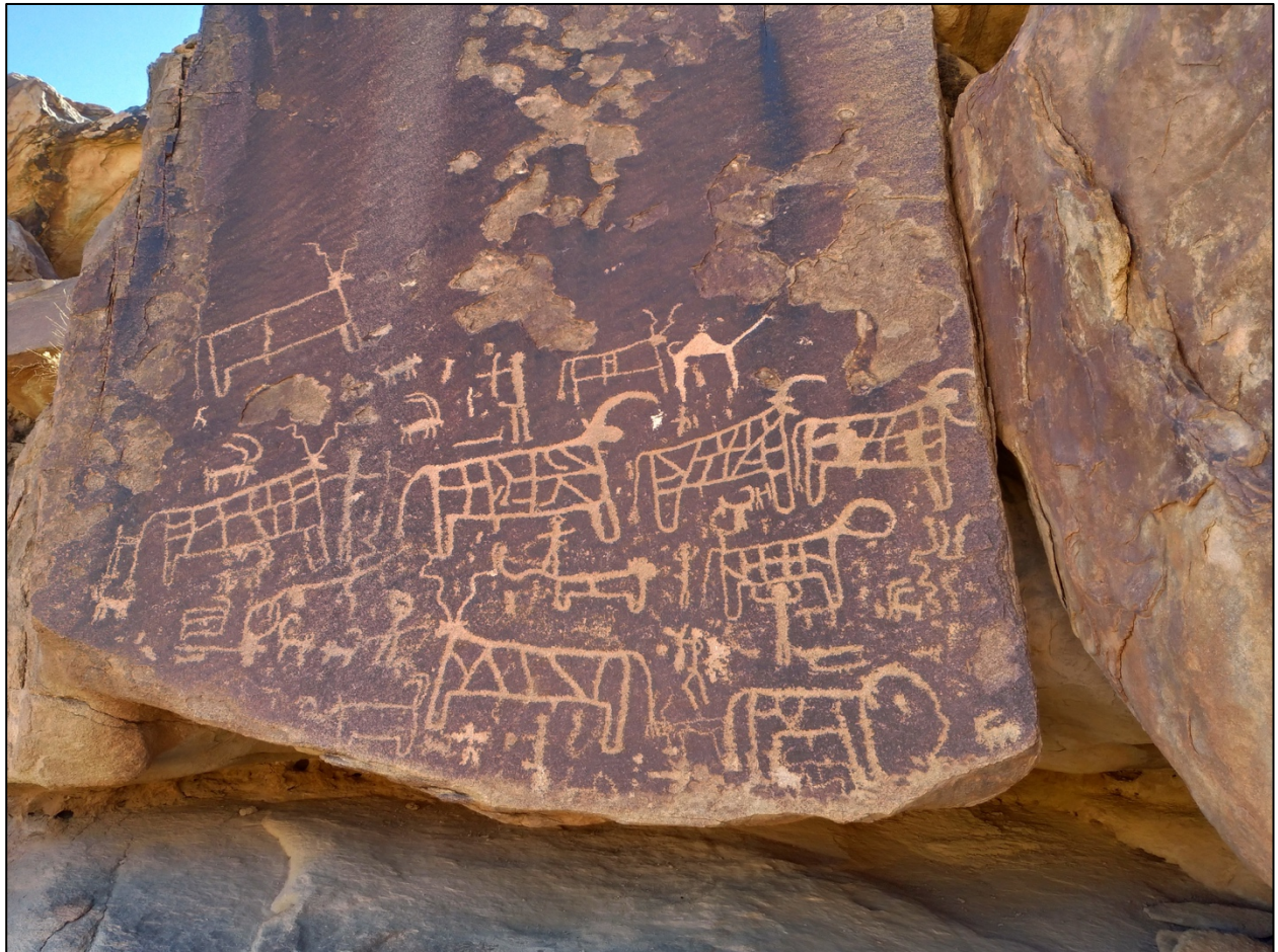
Culte des vaches au pied du mont Sinaï, Arabie Saoudite

À Madian, Dieu a jugé les Hébreux pour leur culte du veau d'or. Ils pouvaient littéralement voir la gloire de Dieu au sommet de la montagne, mais ils adoraient un jeune taureau créé par l'homme. L'apôtre Paul dit dans 1 Corinthiens 10 : 8 que 23 000 Hébreux sont morts ce jour-là à cause du faux culte.