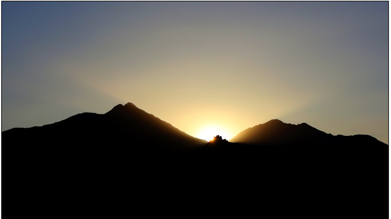
Coucher de soleil sur le mont Sinäï en Arabie Saoudite

Quand Dieu rencontra Moïse dans le buisson ardent, il dit, “quand tu auras fait sortir d'Égypte le peuple, vous servirez Dieu sur cette montagne.” (Exode 3:12). Ainsi, après que le Seigneur ait délivré le peuple d'Israël des Égyptiens, ils se sont rendus à la “montagne de Dieu” à Madian, où Dieu s'était révélé pour la première fois à Moïse (Exode 18 : 5, 24 : 13).