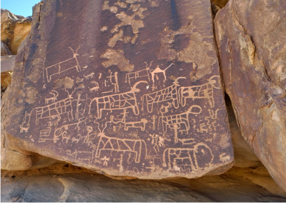
عبادة البقرة في سفح جبل سيناء، المملكة العربية السعودية

في مديان أدان الله العبرانيين لعبادتهم للعجل الذهبي. لقد كان بإمكانهم حرفياً رؤية مجد الرب على قمة الجبل، ولكنهم عبدوا عجل من صنع البشر. ويقول الرسول بطرس في كورنثوس الأولى ١٠: ٨ أن ثلاثة وعشرون ألف هلكوا في ذلك اليوم بسبب تلك العبادة الباطلة.