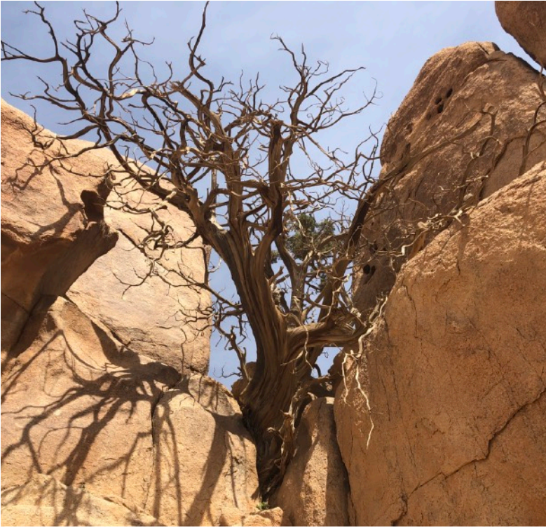
لربما كانت العليقة المحترقة تبدو كهذه