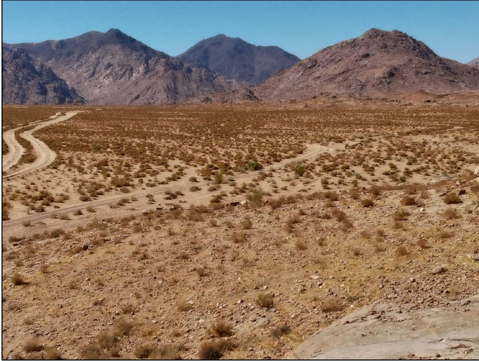
Posible campamento en el Sinaí en Madián, vista del primer tabernáculo