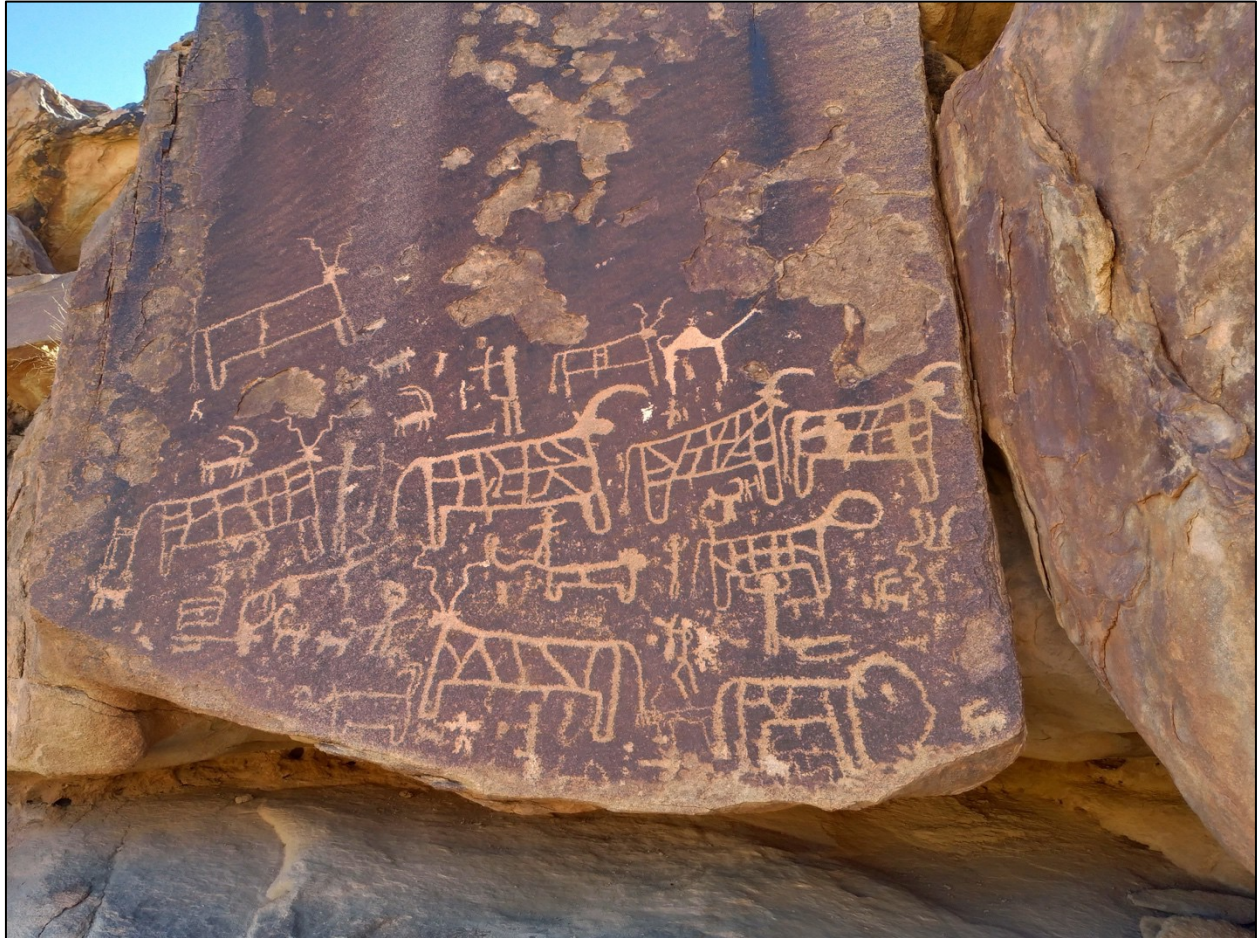
Adoración de vacas en la base del Monte Sinaí, Arabia Saudita

En Madián, Dios juzgó a los hebreos por la adoración de un becerro de oro. Literalmente podían ver la gloria de Dios en la cima de la montaña, pero adoraban a un toro joven hecho por el hombre. El apóstol Pablo dice en 1 Corintios 10:8 que 23.000 hebreos murieron ese día a causa de la adoración falsa.