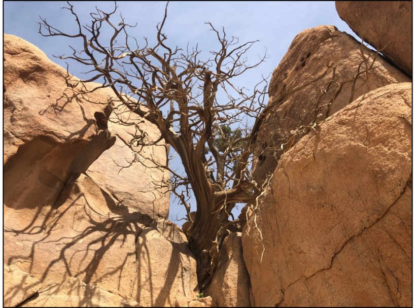
Tal vez la zarza ardiente se veía así