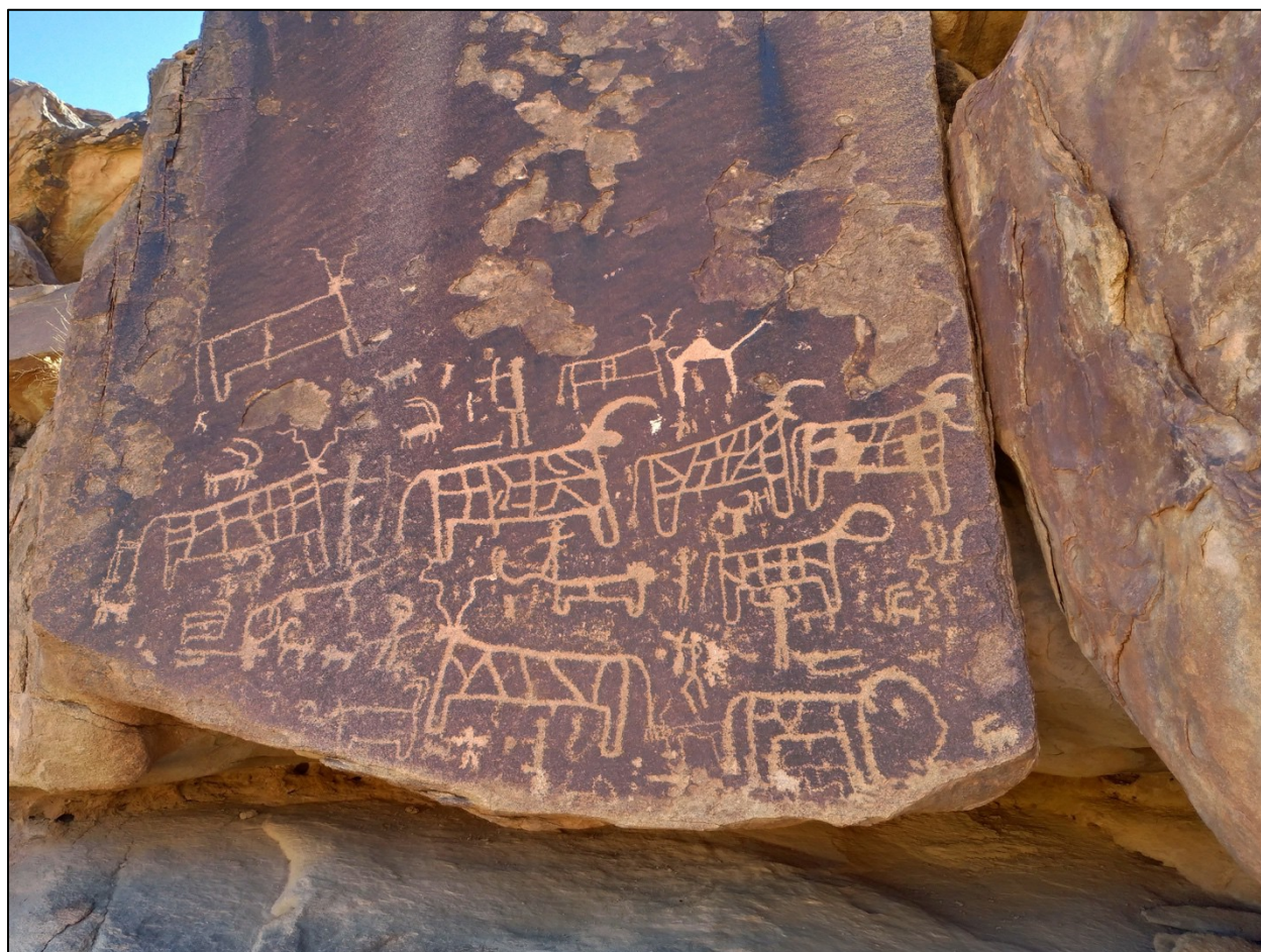
Adoração de vacas na base do Monte Sinai, Arábia Saudita

Em Midiã, Deus julgou os hebreus pela adoração de um bezerro de ouro. Eles podiam literalmente ver a glória de Deus no topo da montanha, mas adoravam um touro jovem feito pelo homem. O apóstolo Paulo diz em 1 Coríntios 10:8 que 23.000 hebreus morreram naquele dia por causa da falsa adoração.