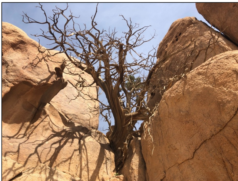
Talvez a sarça ardente parecesse assim