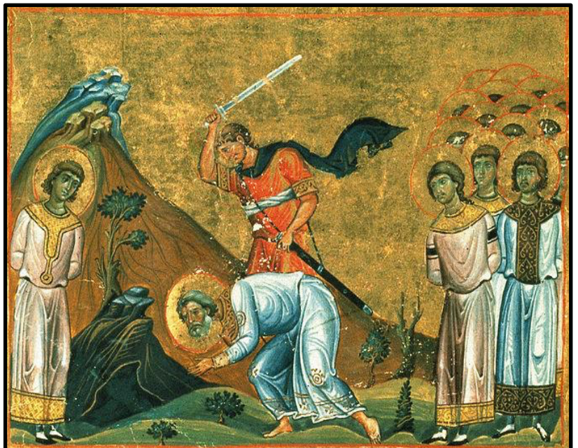
Orthodoxe Ikonographie des Martyriums des Heiligen Arethas

Im Jahr 523 n. Chr. erlitt Nadschran ein schreckliches Massaker durch einen südarabischen jüdischen König, weil sie sich weigerten, Christus abzuschwören. Die gut dokumentierten Geschichten dieser mutigen Märtyrer wurden von der damaligen Kirche bewahrt, und viele Kirchengemeinden gedenken weiterhin ihres Glaubens. In den letzten Jahren haben antike Manuskripte mit zahlreichen historischen Berichten über dieses Ereignis in der Wissenschaft große Beachtung gefunden.