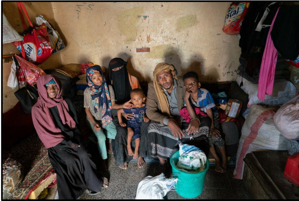
Eine typische jemenitische Familie, die ums Überleben kämpft.