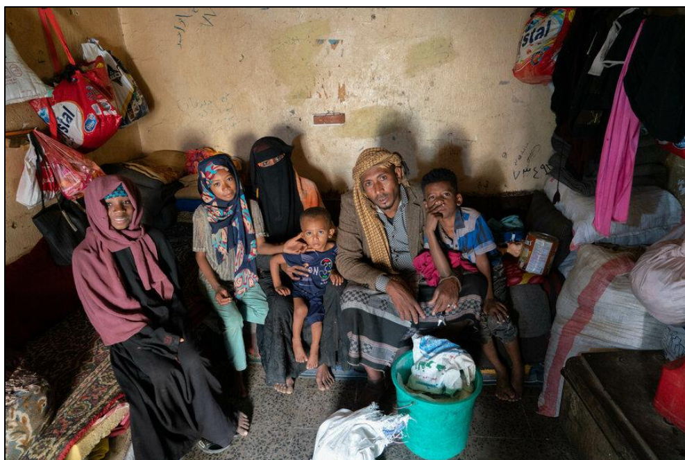
Una familia típica Yemení lidiando como sobrevivir.

contribuido a la crisis de pobreza. Cuando mi propio padre recibe un salario (si lo hace), es menos de medio mes de salario cada cuatro o cinco meses.