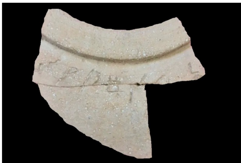
Tesson de poterie écrit en langue sabéenne datant de l'époque du roi Salomon et de la reine de Saba, trouvé à Jérusalem.

Bien que certains érudits supposent que la reine de Saba soit originaire d'Éthiopie, il existe de fortes raisons de situer Saba en Arabie du Sud. Les restes du palais de la reine de Saba se trouvent peut-être sur un site archéologique à Marib, au Yémen. L'un des bâtiments les mieux conservés des ruines, le temple Bar'an (également connu sous le nom de trône de Bilqis), pourrait être l'ancien palais. Sumharam à Khor Ruri, dans le sud d'Oman, aujourd'hui classé au patrimoine mondial de l'UNESCO, est censé être le palais d'été de la reine de Saba. Il est possible que le Yémen, l'Érythrée et l'Éthiopie aient été rejoints à un moment donné par une seule puissance ou un seul royaume ; par conséquent, le royaume de Saba s'étendait peut-être sur la mer Rouge. Néanmoins, les écrits les plus anciens en langue sabéenne [Saba] sur les rochers proviennent du Yémen et non d'Éthiopie. Le Saba d'Isaïe semble également étroitement lié à Oman, au Yémen et à l'Arabie Saoudite, car les quatre autres nations d'Isaïe 60 se trouvent dans la péninsule arabique.