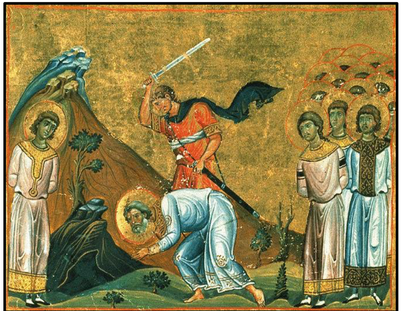
Iconographie orthodoxe du martyre de saint Aréthe

En 523 après JC, Najran fut victime d'un horrible massacre de la part d'un roi juif du sud de l'Arabie après avoir refusé de renoncer au Christ. Des histoires bien documentées sur ces courageux martyrs ont été préservées par l'Église de cette époque, et de nombreuses communautés ecclésiales continuent de commémorer leur foi. Ces dernières années, les manuscrits anciens contenant de nombreux récits historiques de cet événement ont reçu beaucoup d'attention de la part des universitaires.