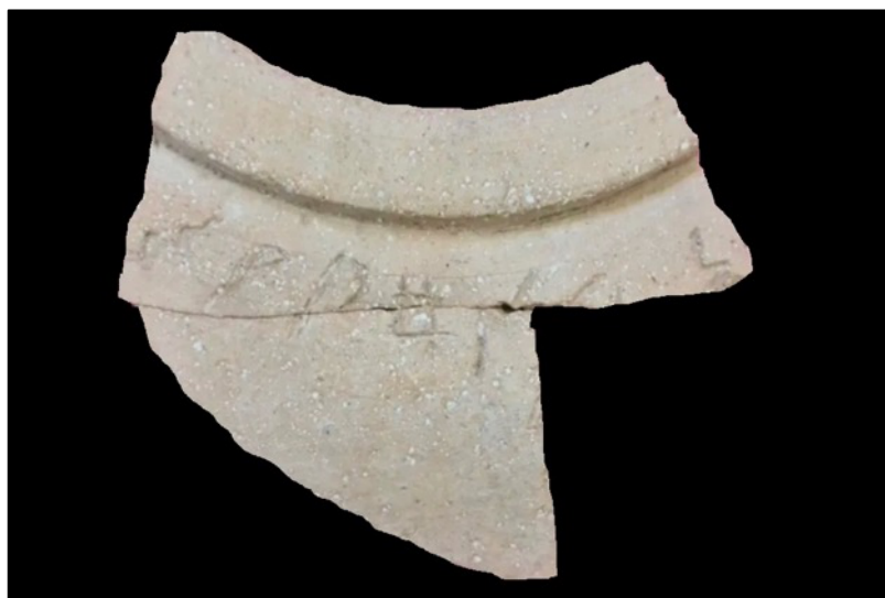
Fragmento de cerâmica escrito na língua sabéica que data da época do rei Salomão e da rainha de Sabá, encontrado em Jerusalém.

Embora alguns acadêmicos suponham que a Rainha de Sabá seja da Etiópia, existe uma base sólida para localizar Sabá no sul da Arábia. As ruínas do palácio da Rainha de Sabá podem estar em um sítio arqueológico em Marib, no Iêmen. Um dos edifícios mais bem preservados nas ruínas, o Templo Bar'an (também conhecido como Trono de Bilqis), pode ser o antigo palácio. Sumharam em Khor Ruri, no sul de Omã, hoje Patrimônio Mundial da UNESCO, é supostamente o palácio de verão da rainha de Sabá. É possível que o Iêmen, a Eritreia e a Etiópia, em um determinado momento no passado, tenham sido unidos por um poder ou reino governante; portanto, o reino de Sabá pode ter atravessado o Mar Vermelho. No entanto, os escritos mais antigos da língua Sabá [Sheba] nas rochas vêm do Iêmen, não da Etiópia. A Sabá de Isaías também parece estar intimamente ligada a Omã, ao Iêmen e à Arábia Saudita porque as outras quatro nações de Isaías 60 estão na Península Arábica.