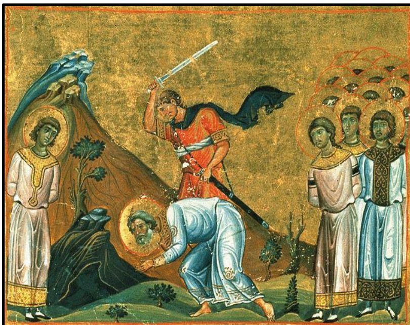
Iconografia ortodoxa do martírio de São Aretas.