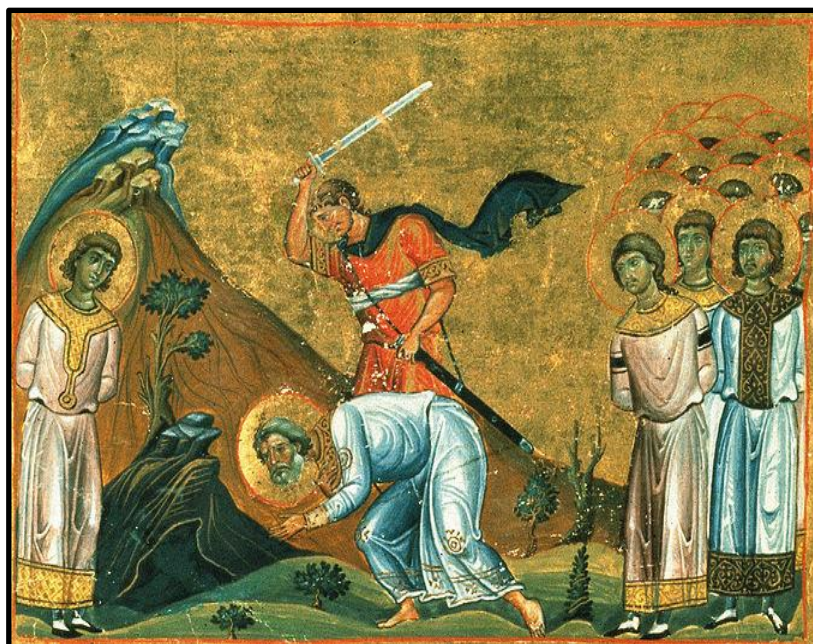
Iconografie ortodoxă a martiriului Sfântului Aretha

Mii de credincioși care au refuzat să-L tăgăduiască pe Hristos au fost supuși torturii de către persecutorii lor evrei, cu aproximativ o sută de ani înainte de apariția islamului. Liderul comunității creștine din Najran la acea vreme, Harith (Aretha), era un bătrân iubit și respectat. Acestei persecuții devastatoare au fost supuși atât bărbații cât și femeile și copiii, sclavii și oamenii liberi, clericii și mireni, arabii locului și străinii.