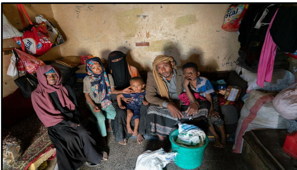
O familie tipic yemenită care se luptă să supraviețuiască.

Conflictul în curs a dus la o scădere a activităților economice, inclusiv la perturbarea comerțului și la reducerea producției agricole. În părțile de nord ale Yemenului, majoritatea angajaților publici guvernamentali nu au primit salarii de mulți ani. Acești factori au contribuit la adâncirea sărăciei. Când tatăl meu primește salariul la fiecare patru-cinci luni (dacă îl primește), acesta este mai puțin de jumătate din salariul obișnuit pe o lună.