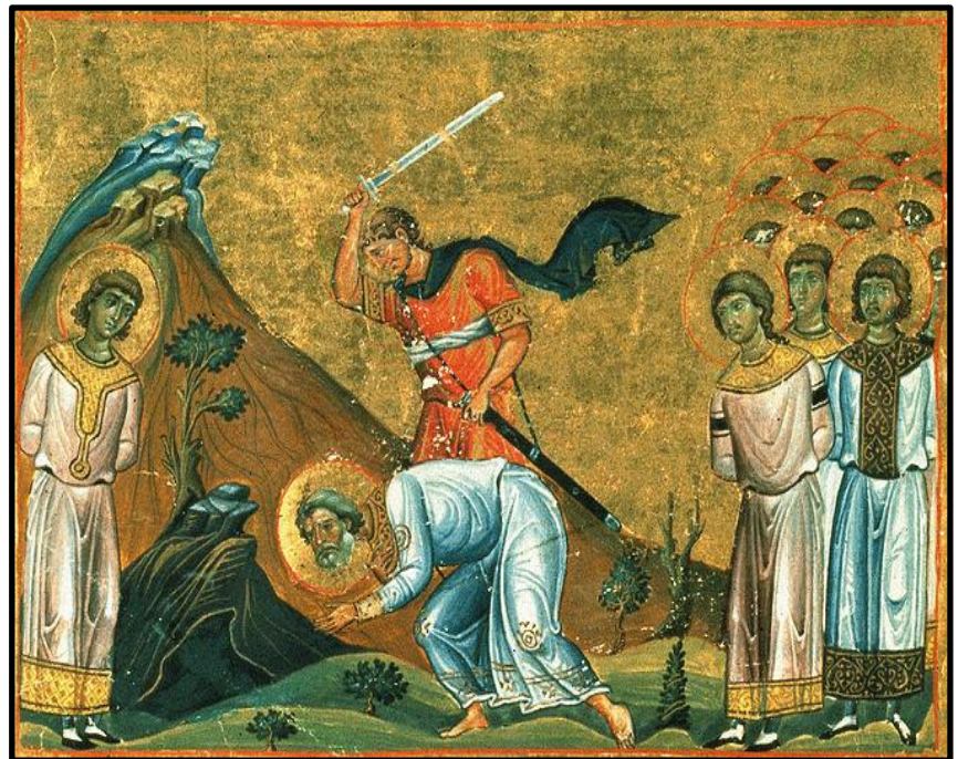
聖阿雷薩斯殉難的東正教肖像

公元 523 年，奈季蘭因拒絕放棄跟隨基督而遭受到南阿拉伯猶太王的可怕屠殺。當時的教會詳細記存這些勇敢殉道者的故事，許多教會團體繼續紀念殉道者的信仰。近年來，大量有關此事件的古代手稿廣泛受到學術界學者的關注。