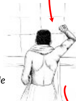
Pedras, três pilares onde apedrejam Satanás