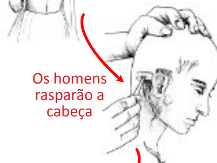
Os homens rasparão a cabeça