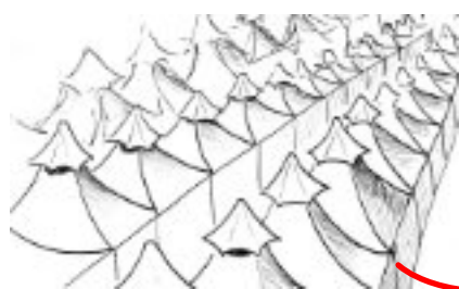
Mina, cidade da barraca