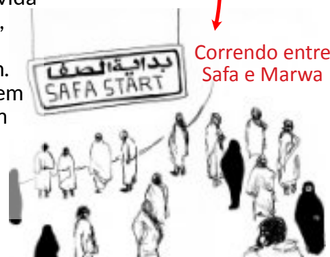
Correndo entre Safa e Marwa