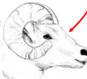
Sacrifício de animal