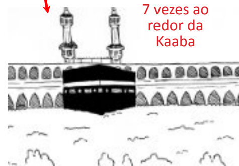
7 vezes ao redor da Kaaba