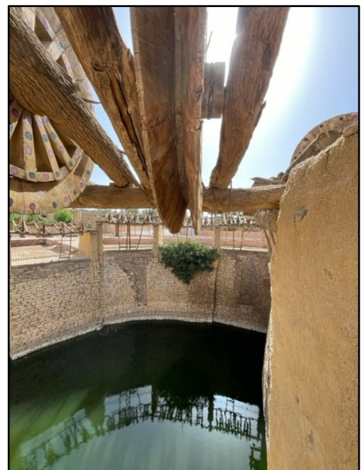
提玛水源丰足的井