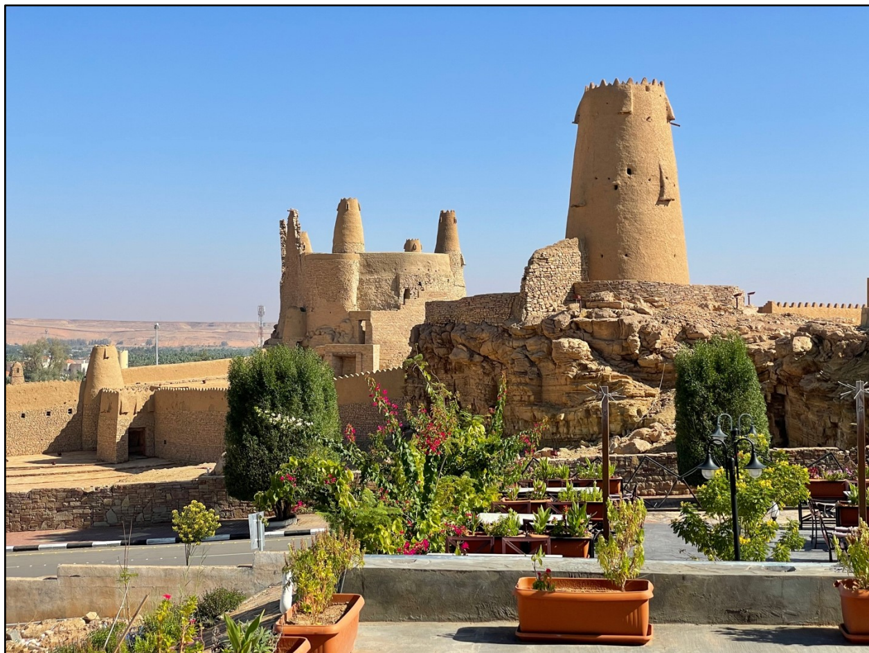
沙地阿拉伯 基达尔 杜马特詹达尔古堡 以赛亚书 21:11-12